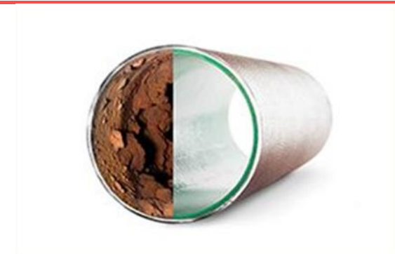
"Nye rør uden byggerod"